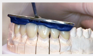
Saisir la prothèse sur le modèle.