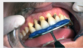
Porter la prothèse garnie du ciment en bouche.

Cas clinique : Courtoisie du Dr Manuel Munoz.