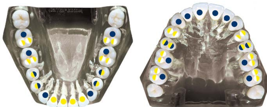
SUGGESTIONS POUR LE CHOIX DE LA TAILLE DU TENON (A TITRE INDICATIF UNIQUEMENT)